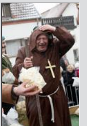
Le Pape annonçait hier sa démission, mais le "Clergé" n'a pas manqué la fête pour autant.