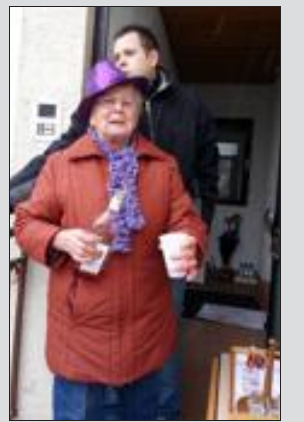
A Reinheim, tout le monde participe à la fête, les habitants accueillant volontiers les carnavaliers pour un petit remontant.