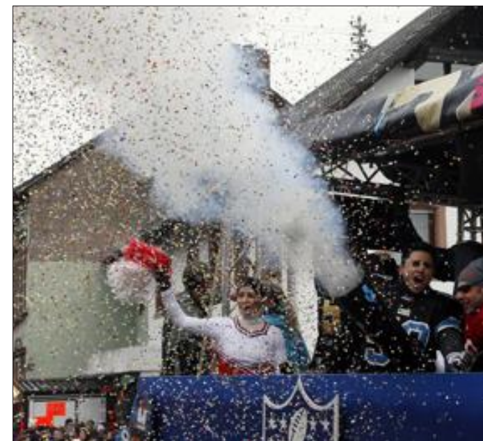
Elément incontournable de la cavalcade, le canon à confettis, qui a particulièrement bien fonctionné depuis le char de la NFL.

Cavalcade colorée, avec des participants motivés, un public souvent déguisé, l'ambiance, quel que soit le temps, est toujours à la fête à Reinheim !