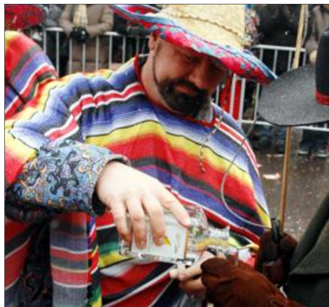
Tradition à Reinheim, on réchauffe le cœur et le gosier des badauds.