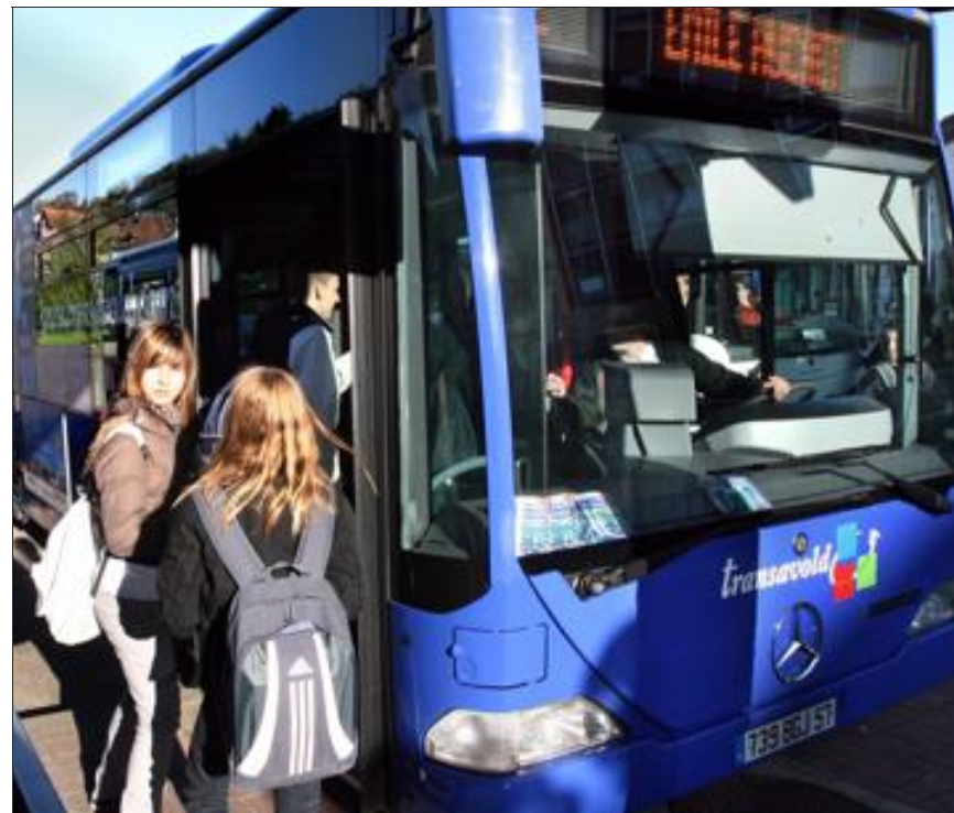
La ligne MSI, qui relie Saint-Avold à Sarrebruck, en passant par Forbach, augmentera dès avril la fréquence de ses trajets et les arrêts à Sarrebruck.